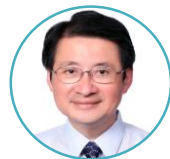
吳玉山 榮譽講座教授 中研院院士 台大政治所教授

最高學歷：英國華威大學政治與國際研究系博士 專長：政治理論、政治哲學、國際政治理論、社會科學哲學、 鄂蘭思想、傅柯思想