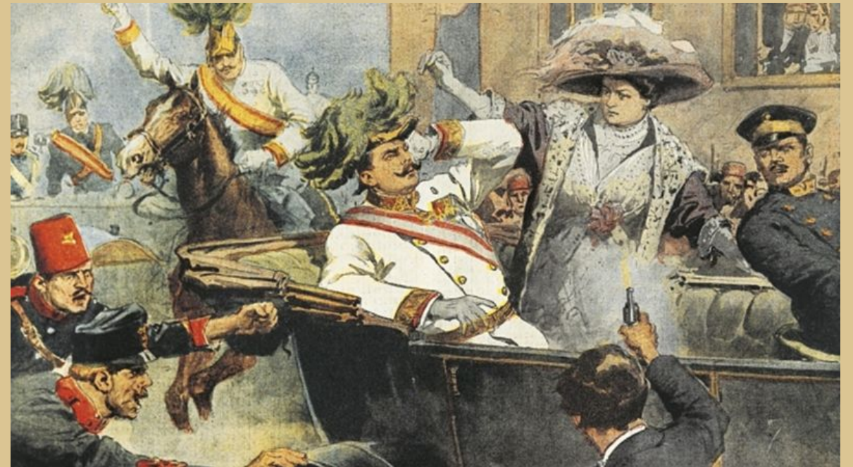
Assassination of Archduke Franz Ferdinand of Austria when he visited Sarajevo, June 28, 1914