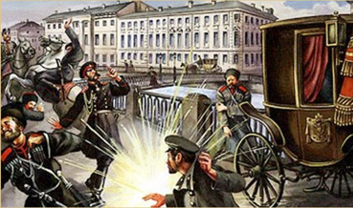
Assassination of Alexander II twenty years after he emancipated the Russian serfs. St. Petersburg, March 13, 1881