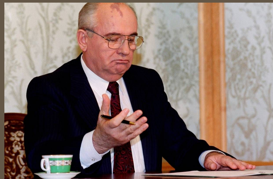
The final stroke